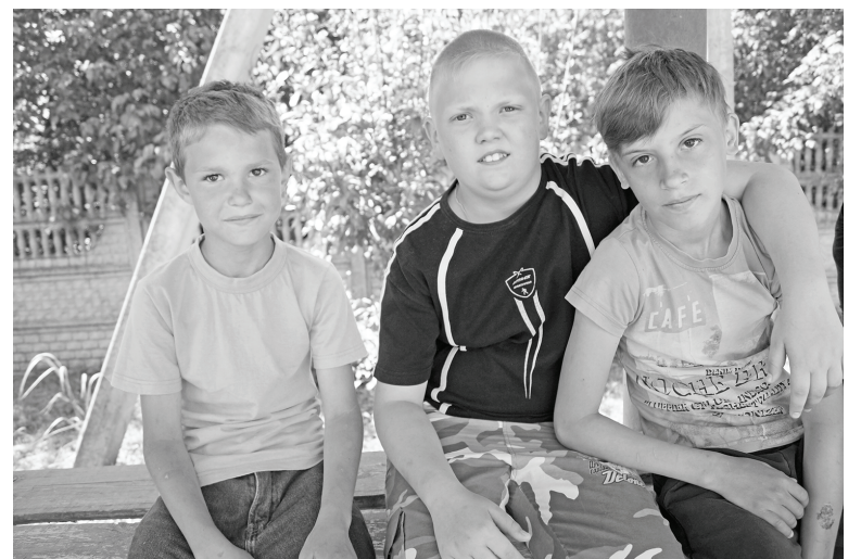
Пацаны. Фото с выставки.