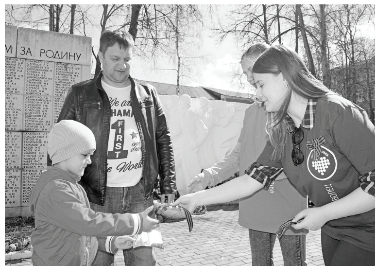
В эти дни на думиничской земле идет акция «Георгиевская ленточка».